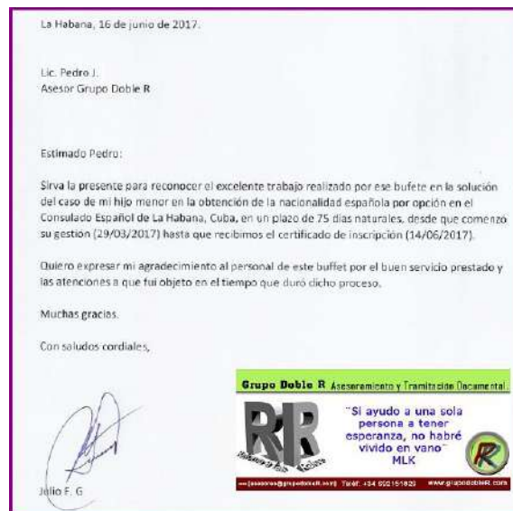
Testimonio escrito del padre del menor. Imagen a partir documento original. Ed Grupo Doble R

Conclusiones definitivas: Este expediente, según nuestra opinión, está completo y se ajusta a derecho (si todos los documentos aportados se corresponden con los originales entregados al Consulado)