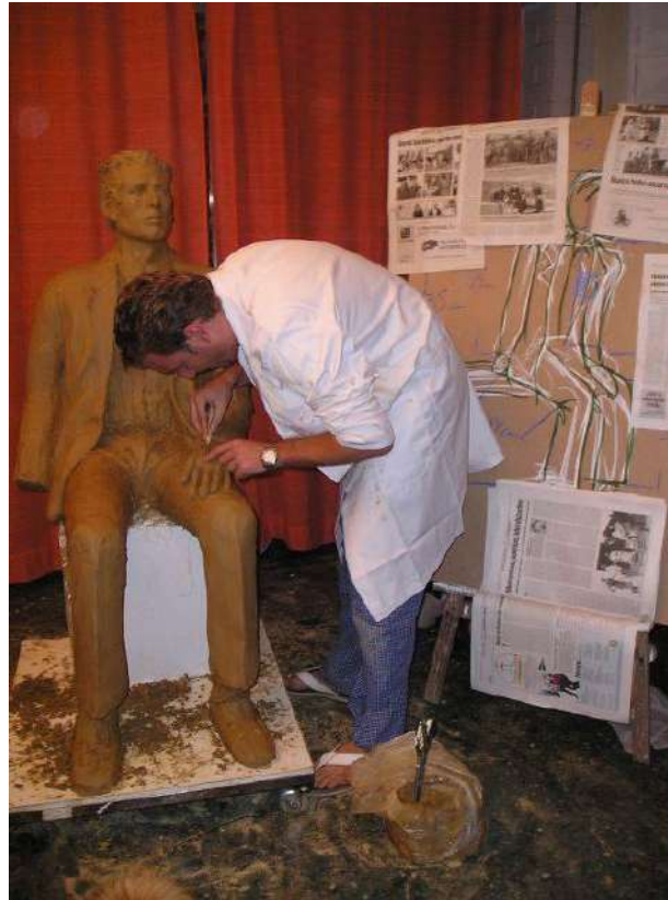
Proceso de creación del escultor del Emigrante.

Estuve nueve años consecutivos casi dos meses enteros